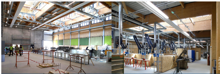
Une des nouvelles halles a été mise en service début 2023, y sont installées les formations STI2D, TISEC, TP et GO.