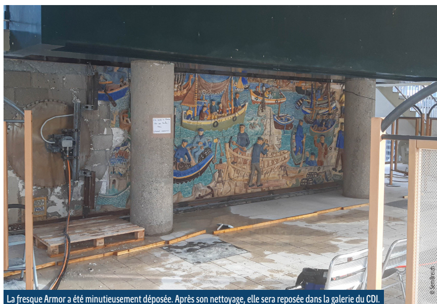
La fresque Armor a été minutieusement déposée. Après son nettoyage, elle sera reposée dans la galerie du CDI.