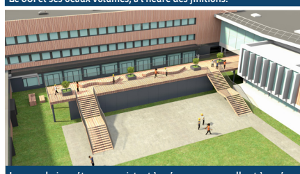
Les prochaines étapes consistent à créer une passerelle et à aménager la cour paysagère entre le bâtiment A et les ateliers.