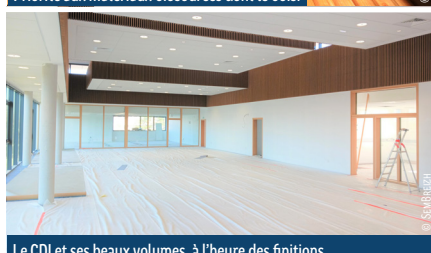
Le CDI et ses beaux volumes, à l'heure des finitions.