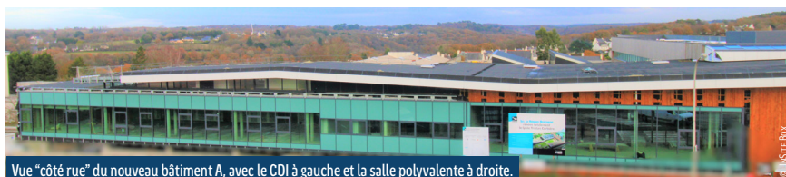
Vue "côté rue" du nouveau bâtiment A, avec le CDI à gauche et la salle polyvalente à droite.