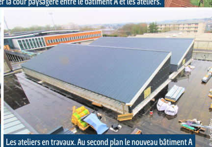
Les ateliers en travaux. Au second plan le nouveau bâtiment A