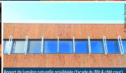
Apport de lumière naturelle privilégiée (façade du Bât A côté cour)