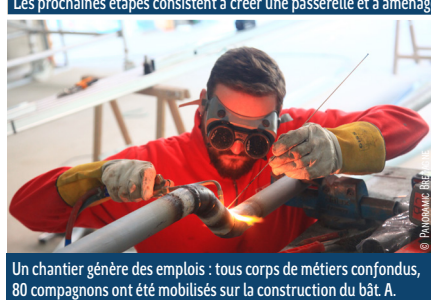
Un chantier génère des emplois : tous corps de métiers confondus, 80 compagnons ont été mobilisés sur la construction du bât. A.