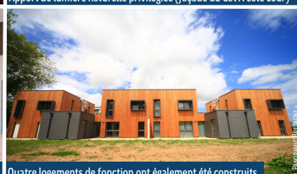
Quatre logements de fonction ont également été construits.