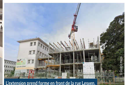
L'extension prend forme en front de la rue Lesven.