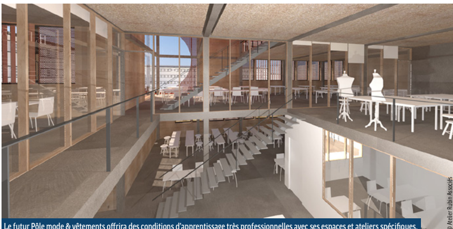
Le futur Pôle mode & vêtements offrira des conditions d'apprentissage très professionnelles avec ses espaces et ateliers spécifiques.