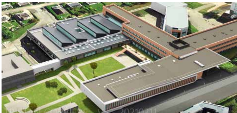
Le bâtiment A (au 1 er plan) se prolongera pour recouvrir l'actuel parvis et former un hall relié aux bâtiments B et C. Une liaison permettra de rejoindre les ateliers (en haut) depuis le hall en surplombant la cour paysagère. © Mstream

lyvalente sur un étage et, au niveau inférieur, un pôle santé, des locaux techniques, un abri vélos et quelques places de stationnement. Il sera prolongé, jusqu'au parvis d'accueil, par une jonction couverte qui viendra créer un hall fonctionnel relié aux bâtiments B et C. Grâce à une isolation thermique performante, l'utilisation de matériaux biosourcés et un apport maximisé de lumière naturelle, le nouvel équipement permettra de réduire de manière forte les consommations d'énergie. Parallèlement, la construction de 4 nouveaux logements de fonction, à l'arrière du lycée, s'achèvera cet automne.