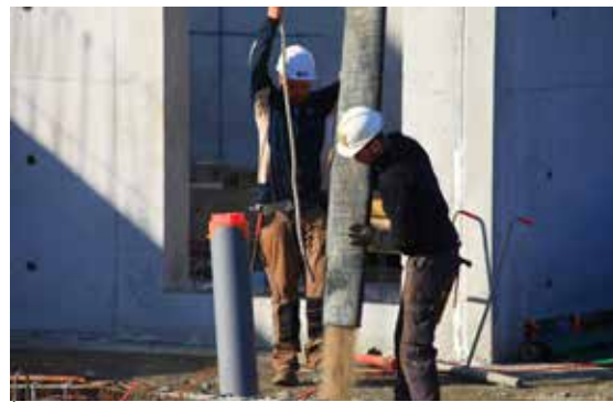
A travers les investissements qu'elle réalise dans les lycées, la Région Bretagne est créatrice d'emplois locaux.

Débuté en 2020 et prévu jusqu'à l'été 2024, le chantier -ou plutôt devrait-on parler des chantiers- mobilise dans leur très grande majorité des entreprises finistériennes ou costarmoricaines. Qu'il s'agisse du gros œuvre, de la voirie et des réseaux, de la maçon-