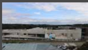
Septembre 2021 Fin d'élévation des murs du 2 e niveau