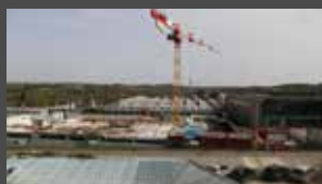
Avril 2021 Fin de l'élévation du 1 er niveau