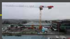
Février 2021 Début d'élévation des murs