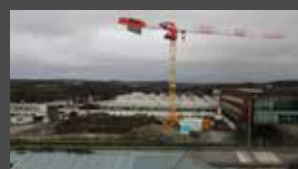
Décembre 2020 Préparation des fondations