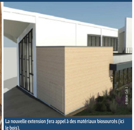
La nouvelle extension fera appel à des matériaux biosourcés (ici le bois).