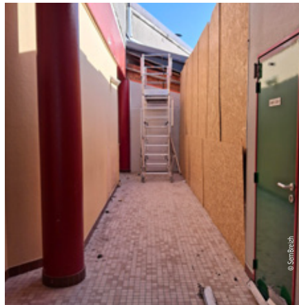
Les espaces de l'ancien lycée vont être restructurés pour laisser place à des plateaux techniques destinés à la formation en soin infirmiers.