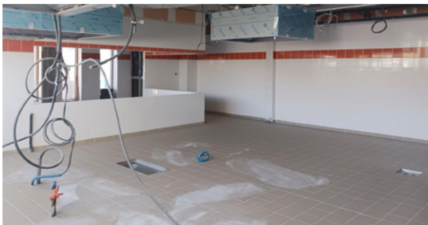
La nouvelle cuisine offrira de meilleures conditions de travail aux personnels grâce à son grand espace et sa luminosité naturelle.