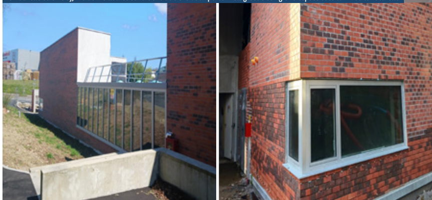
La première extension créée s'inscrit parfaitement dans l'architecture existante en reprenant les matériaux déjà présents dans l'établissement : la brique rouge, le verre et le bois.