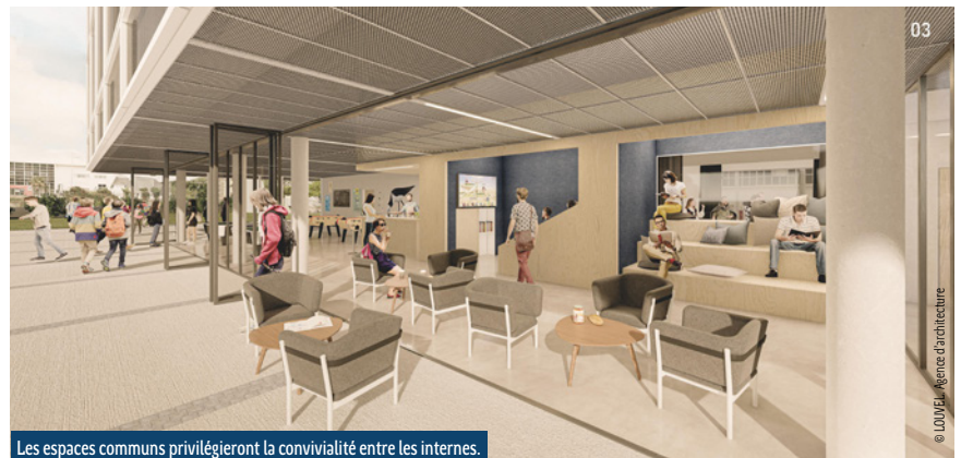
Les espaces communs privilégieront la convivialité entre les internes.

sociale : en lien avec la ville, des personnes éloignées de l'emploi vont bénéficier de contrats de professionnalisation pour découvrir les métiers du terrassement, du gros œuvre, de la menuiserie... afin de les aider à retrouver la voie de l'emploi.