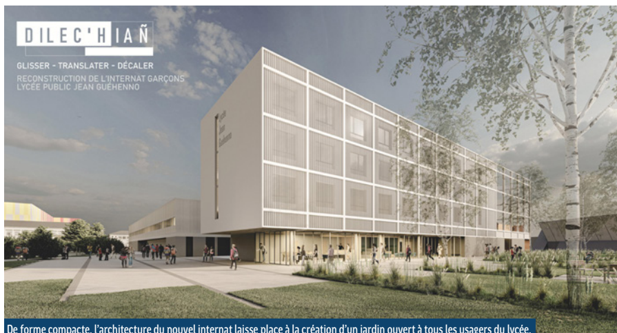
De forme compacte, l'architecture du nouvel internat laisse place à la création d'un jardin ouvert à tous les usagers du lycée.

Loïc Chesnais-Girard, Président de la Région Bretagne