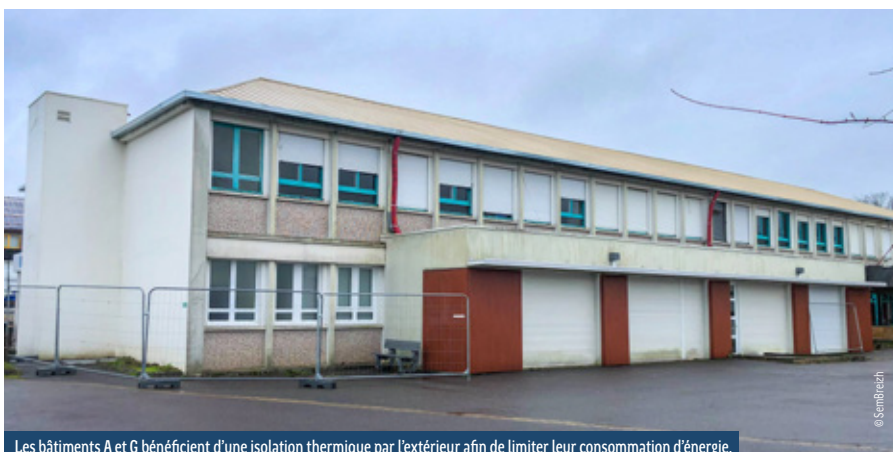
Les bâtiments A et G bénéficient d'une isolation thermique par l'extérieur afin de limiter leur consommation d'énergie.