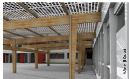
Un préau photovoltaïque de 200 m 2 va être adossé aux ateliers.

Alors que La Région veut accroître la production d'énergie renouvelable en Bretagne, elle valorise les surfaces disponibles sur son patrimoine bâti pour y installer des panneaux photovoltaïques. Ainsi, au lycée Zola, les deux préaux existants seront refaits à neuf et l'un d'eux sera par la suite couvert de 200 m 2 de panneaux photovoltaïques. Les panneaux solaires seront translucides et permettront au préau de profiter de la lumière naturelle. Les travaux de rénovation débuteront en février 2025.