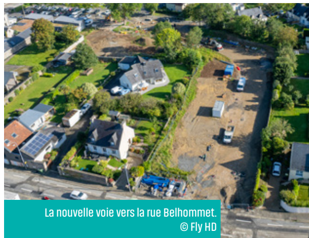
La nouvelle voie vers la rue Belhommet. © Fly HD