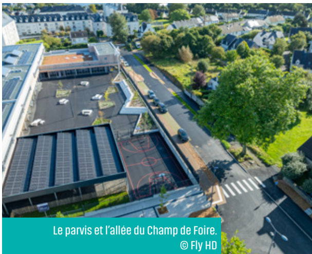
Le parvis et l'allée du Champ de Foire.

Au sud-ouest du collège, un parvis exclusivement réservé aux bus scolaires a également été aménagé afin de sécuriser la desserte de l'établissement.