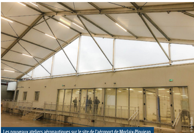
Les nouveaux ateliers aéronautiques sur le site de l'aéroport de Morlaix-Ploujean.

Loïc Chesnais-Girard, Président de la Région Bretagne