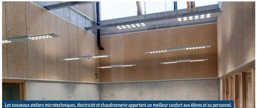
Les nouveaux ateliers microtechniques, électricité et chaudronnerie apportent un meilleur confort aux élèves et au personnel.