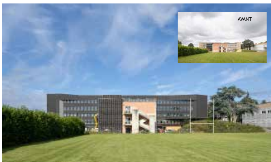
En juillet 2021, la rénovation des façades du bâtiment D s'achève quand débute celle du bâtiment C.