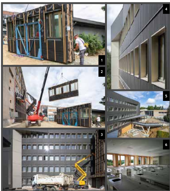
1-2 : Préfabriquées en atelier, les façades isolées sont livrées sur site sous forme de panneaux puis posées. 3-4 : Le bardage métallique noir est ensuite fixé. 5 : La passerelle de liaison. 6 : Le nouvel espace scientifique du bâtiment D accueille ses 1 ers élèves en cette rentrée 2021.

Aujourd'hui, les travaux se poursuivent avec la remise à neuf de l'intérieur de l'aile Sud du bâtiment D (rez-de-chaussée, étages 1 et 2). Parallèlement, le renouvellement des façades du bâtiment C a débuté, il se poursuivra par sa rénovation intérieure jusqu'en avril 2022. Initialement prévue en novembre 2022, la fin des travaux a été reportée de trois mois en raison du contexte sanitaire qui a ralenti les opérations.