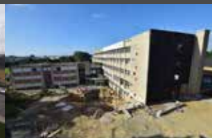
Juillet 2020 Préparation et pose de façades