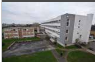
Janvier 2020 Lancement des travaux