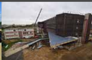
Octobre 2020 Nette avancée sur la pose des façades du bâtiment D