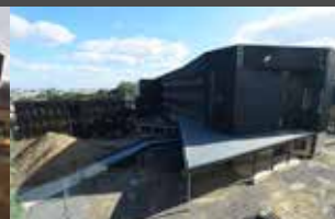
Juillet 2021 Habillage du bâtiment D quasi achevé et pose des façades du bâtiment C