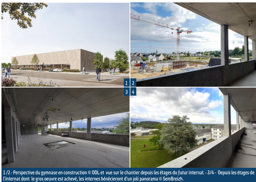
1/2 - Perspective du gymnase en construction et vue sur le chantier depuis les étages du futur internat. - 3/4 - Depuis les étages de l'internat dont le gros œuvre est achevé, les internes bénéficieront d'un joli panorama.

Ici, en lien avec les structures d'insertion locales, 7 300 heures d'insertion seront valorisées sur ces chantiers.