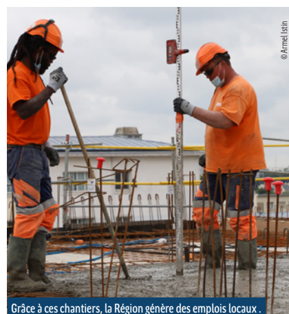
Grâce à ces chantiers, la Région génère des emplois locaux.