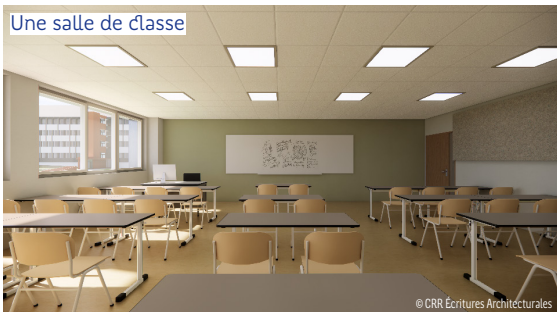
Une salle de classe

La Région est propriétaire du bâti des 116 lycées publics bretons. Elle investit chaque année 110 millions d'euros pour moderniser et entretenir ce patrimoine afin d'offrir un cadre de vie agréable et adapté aux lycéennes et aux lycéens, ainsi qu'aux équipes qui les entourent.