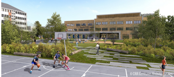
La cour végétalisée

L'ancienne grande cour bitumée a disparu... Pour développer la biodiversité locale et améliorer la gestion des eaux de pluie, les espaces extérieurs sont désormais végétalisés sur une surface de 9 270 m 2 . Le plateau sportif refait à neuf est entouré de cheminements piétons, d'espaces plantés, de noues paysagères, d'un solarium, de serres pédagogiques dédiées aux formations Segpa. Un environnement "nature" dont les élèves pourront profiter lors des temps de pause grâce aux bancs et gradins à disposition.